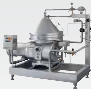
Biotechnologies - Clarificateur d'acide lactique avec récupération des bactéries