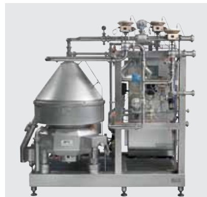
Laiterie - Ecrémeuse avec système de standardisation automatique