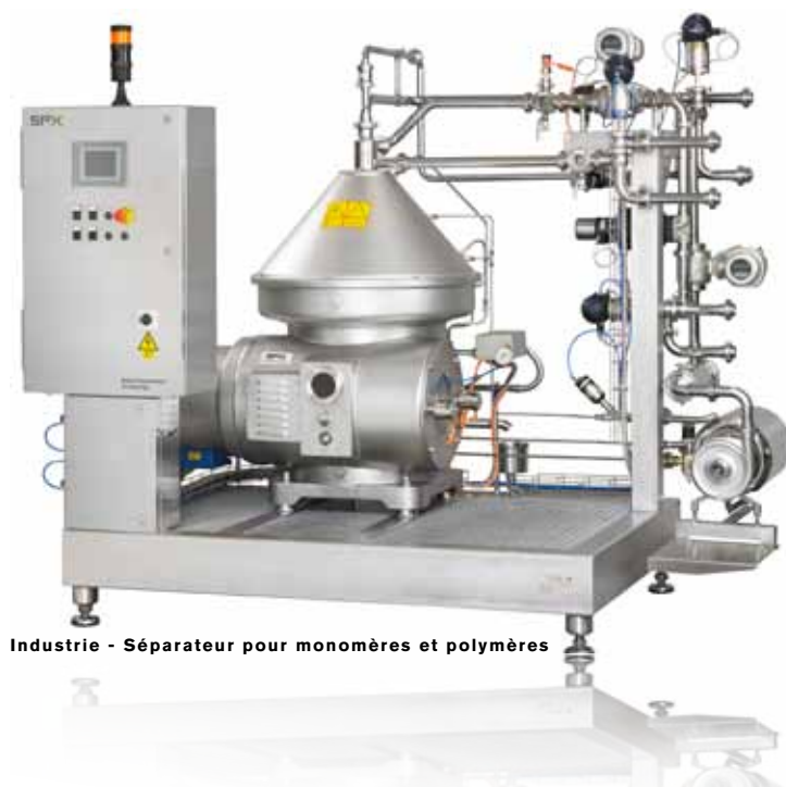
Industrie - Séparateur pour monomères et polymères

SPX est spécialisé dans la fourniture d'équipements configurés spécifiquement par rapport aux requis de l'application en se basant sur une analyse attentive des besoins en collaboration avec nos clients. Les séparateurs et clarificateurs Seital sont disponibles en version plateforme pré-montée, en version "prêt-à-produire". Ils sont d'un niveau de rendement exceptionnel, compacts et faciles à intégrer à des lignes de production existantes, vous permettant ainsi de produire à pleine capacité immédiatement après raccordement à la puissance et aux réseaux d'eau auxiliaires.