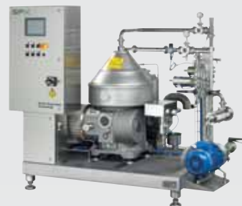
Boissons alcoolisées - Clarificateur pour vins et vins pétillants